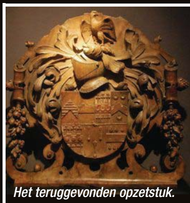
Het teruggevonden opzetstuk.

Maaseikenaar vindt mysterieus verdwenen Brits kunstwerk terug