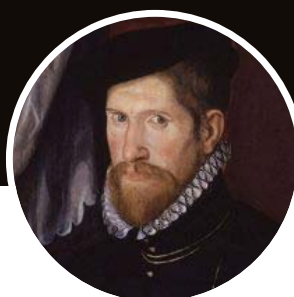
Portret van Nicholas Throckmorton.

Maaseikenaar vindt mysterieus verdwenen Brits kunstwerk terug